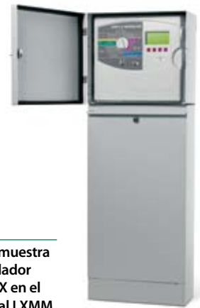
El LXMMPED se muestra con el controlador modular ESP-LX en el gabinete de metal LXMM