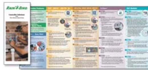
Folleto de soluciones de controladores (en inglés)