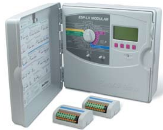
Controlador modular ESP-LX