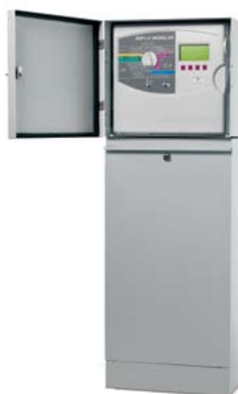
Modular ESP-LX en gabinete de metal LXMM opcional