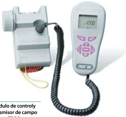
Módulo de control y transmisor de campo TBOS