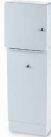
El PED-DD16 se muestra con el ESP-12MC