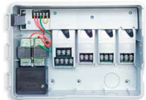
Modular ESP con tres módulos de expansión de estaciones ESPSM3 para un total de 13 estaciones