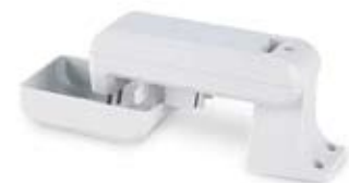
Sistema Rain Check