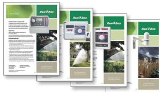
Folleto de venta para opciones adecuadas de controladores