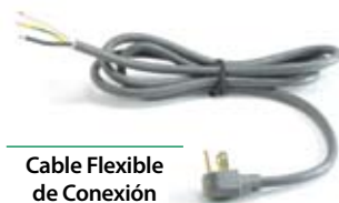
Cable Flexible de Conexión