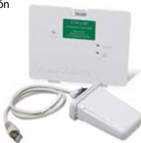
ETM-LXMCartucho ET Manager