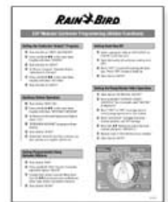
Hoja de programación del controlador modular ESP (Funciones ocultas)

Estas hojas de consulta laminadas de una página son excelentes para los contratistas nuevos en la programación de los controladores modulares ESP, así como para aquellos contratistas que necesitan un recordatorio rápido sobre cómo utilizar todas las funciones ocultas del controlador modular ESP. Las hojas son laminadas para facilitar su transporte y ambas incluyen información en inglés y español. La hoja de programación básica incluye la siguiente información: fecha de configuración, hora, horarios de riego, ciclos de riego, tiempos de funcionamiento de la válvula y el programa Contractor Default™ (predeterminado para el contratista). La hoja de funciones ocultas incluye información sobre el programa Contractor Default™ (predeterminado para el contratista), el funcionamiento de la Estación Auxiliar (Auxiliary Station), el retraso de tiempo entre estaciones, la función Event-day-off (apagado por día de evento) y el funcionamiento de la bomba/válvula maestra.