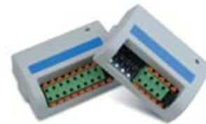
Módulos de 8 estaciones y de 4 estaciones