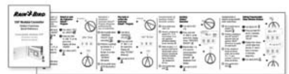
Referencia rápida sobre las funciones ocultas del controlador modular ESP