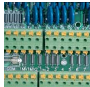
Regleta de terminales de conexión rápida ESP-MC

Nota: Modelos para montar en la pared también disponibles en 230 VCA/50 HZ y 240 VCA/50 HZ